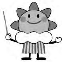
気象庁マスコットキャラクター「はれるん」