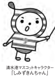
清水港マスコットキャラクター「しみずきんちゃん」

防災科学技術研究所上席研究員・南海トラフ海底地震津波観測網整備推進本部副本部長。海洋研究開発機構上席研究員としてクロスアポイントメント。博士(理学)。文部科学省「防災対策に資する南海トラフ地震調査研究プロジェクト」の課題「創成情報発信研究」の代表も務める。海底観測網の開発や即時津波予測の研究に従事。